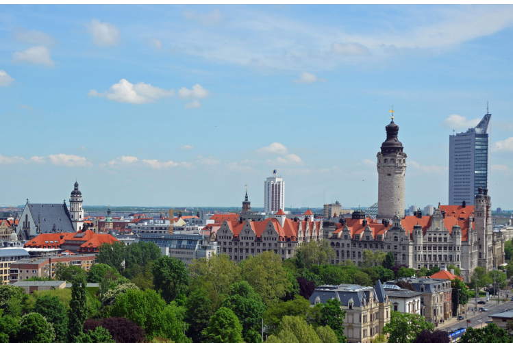
Skyline von Leipzig.